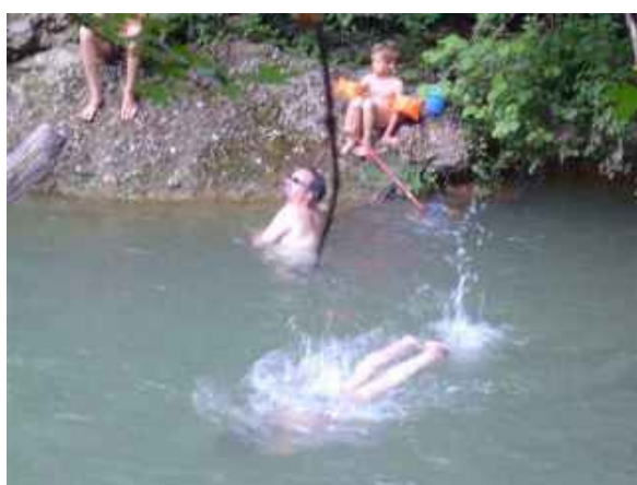
Der Fluss Merse ist als kühle Erfrischung im Sommer immer in Reichweite