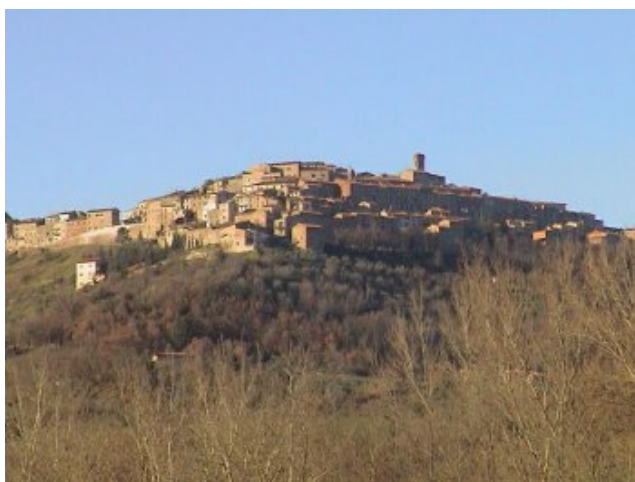
Blick auf das mittelalterliche Dorf Chiusdino