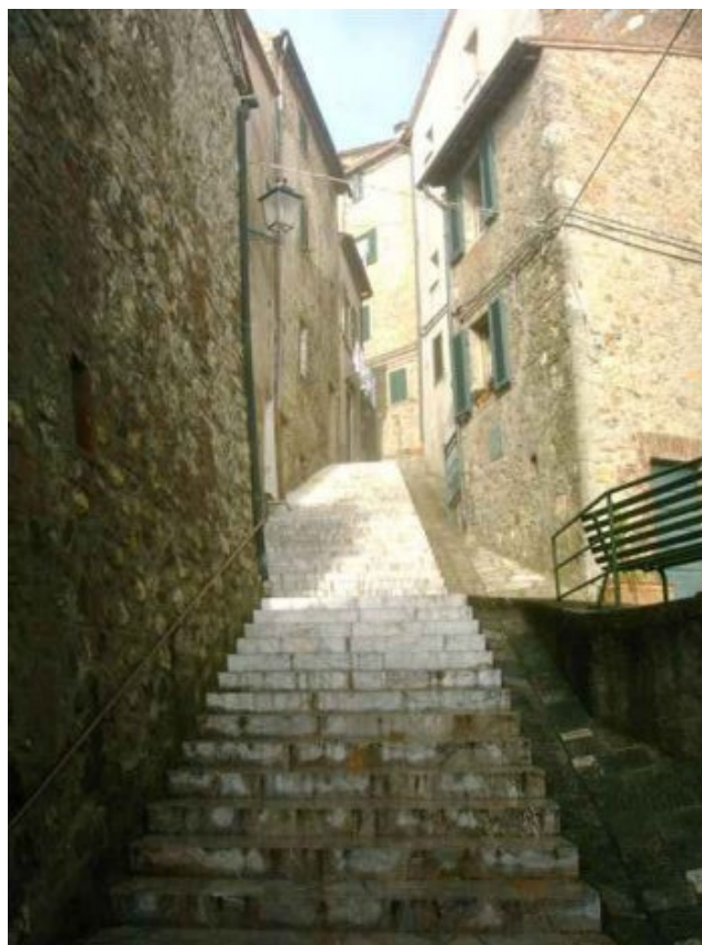
Centro storico / Chiusdino