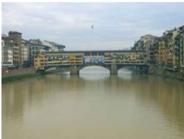
Ponte Vecchio in Florenz