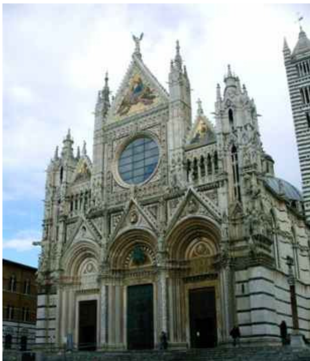
Der Dom von Siena