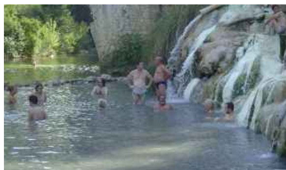
Im Sommer und Winter bieten die heißen Schwefelquellen von Petriolo eine wunderbare Möglichkeit zum entspannten Baden