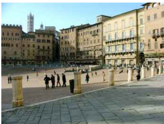
Der Campo di Siena