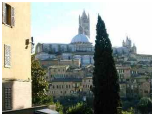
Der Dom von Siena